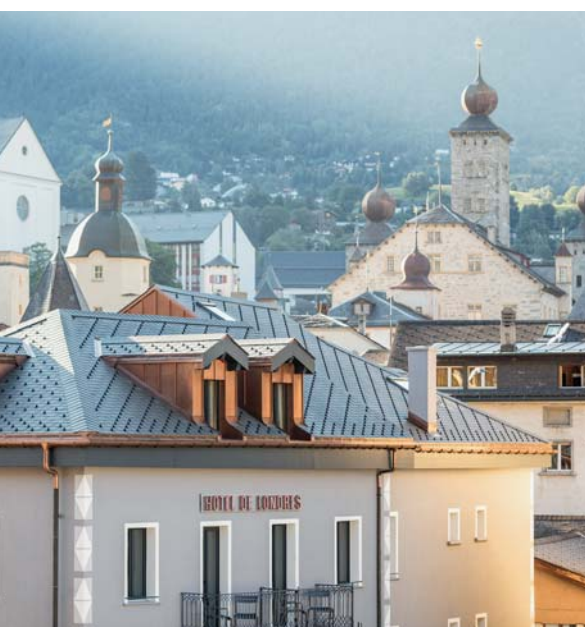
Historisch: Das 2015 renovierte Hotel in Brig empfängt schon seit 1884 Touristen und Besucher.

D er Name irritiert etwas. Hotel de Londres. Was hat denn, bitte schön, die englische Hauptstadt zwischen Berner und Walliser Bergwelt verloren? Auch der Blick auf das Hotelinnere lässt zunächst Zweifel aufkommen: Ist es notwendig, dass man in der 21 000-Einwohner-Ortschaft Brig den Eindruck von Urbanität und Weltgewandtheit erweckt? Die Antwort muss Ja lauten, denn gerade in diesem Hotel in Brig macht das durchaus Sinn.